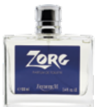
VAJ02 PARFUM DE TOILETTE "ZORG" 100 ML

Citron, lavande et romarin sur fond de santal et bois précieux. Une attaque fraîche et dynamique d'accords verts suivie d'un sillage chaud et persistant.