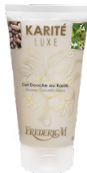
GEL DOUCHE KARITÉ LUXE 150 ML

Cette huile douce et onctueuse devient mousse au fil de l'application et laisse un film protecteur sur la peau. La douche devient un véritable moment de soin.