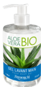
GEL LAVANT MAINS ALOE VERA BIO 300 ML

Ce déodorant composé à 98% d'ingrédients d'origine naturelle contribue à réguler et atténuer la transpiration durablement** sans laisser de traces sur les vêtements**. Il apporte hygiène et fraîcheur** grâce à l'action purifiante et antiseptique de l'huile essentielle de citron.