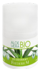
DEODORANT ALOE VERA BIO 50 ML

Cette gamme est conçue pour répondre aux besoins quotidiens de toute la famille.