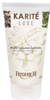
BODY BUTTER KARITÉ LUXE 150 ML

Utilisé quotidiennement, ce gel douche nourrit la peau. Un pur moment de plaisir pour une peau douce et hydratée.