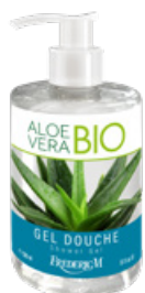
GEL DOUCHE ALOE VERA BIO 300 ML

Les mains sont propres et protégées grâce à sa formule riche en gel d'aloë vera biologique associée à l'huile essentielle de géranium. Un geste quotidien pour toute la famille qui fait du nettoyage un véritable moment de soin.