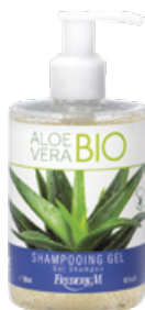
SHAMPOOING GEL ALOE VERA BIO 300 ML

Profitez de ce gel douche pour une sensation de fraîcheur intense. Composé d'aloë vera biologique, reconnu pour ses multiples vertus hydratantes*, apaisantes et régénérantes, il nettoie la peau efficacement tout en respectant son équilibre cutané. Il laisse sur la peau un délicat parfum frais et végétal.