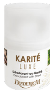
DÉODORANT À BILLE KARITÉ LUXE 50 ML

Composé à 98% d'ingrédients d'origine naturelle, ce beurre riche et nourrissant au Karité Bio rend la peau douce, hydratée et délicatement parfumée.